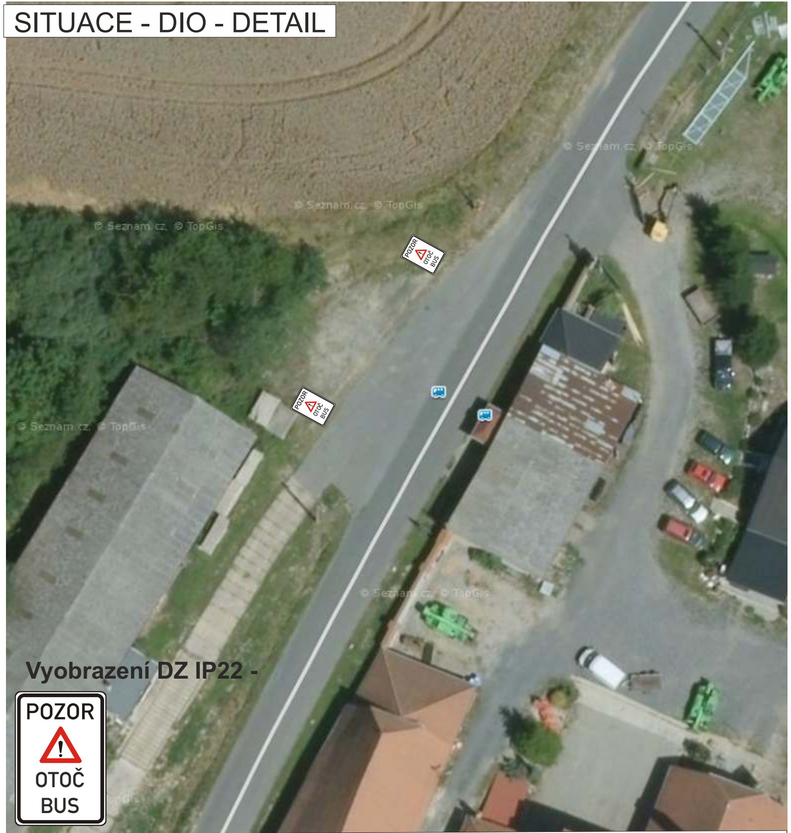
Vyobrazení DZ IP22 -