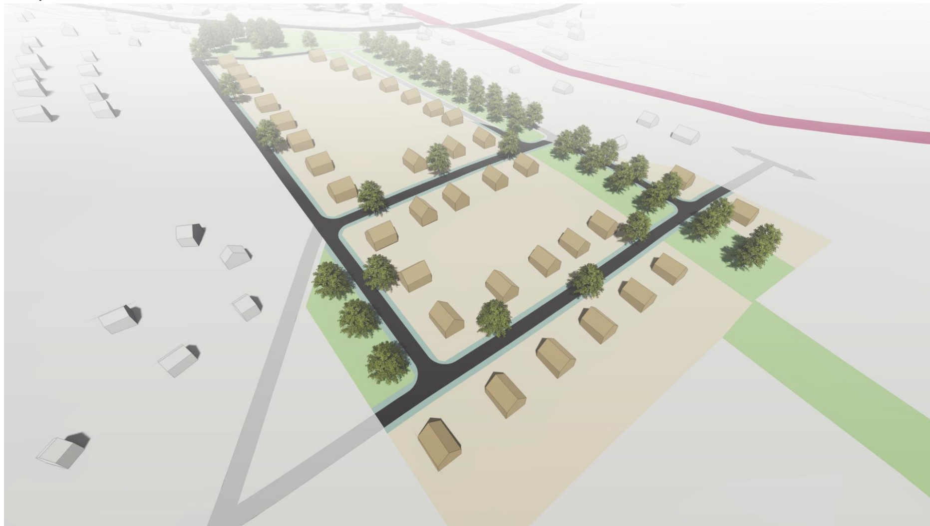
Pohled jižním směrem