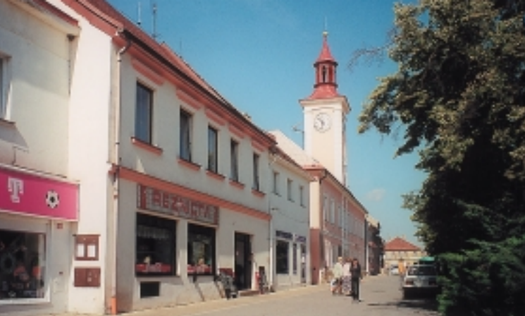
↑ Radnice v Novém Strašecí