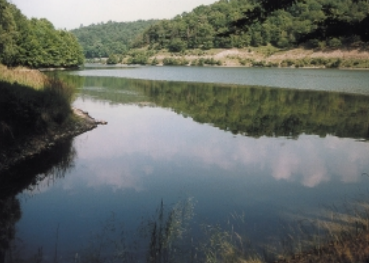
↑ Vodní nádrž Klíčava →