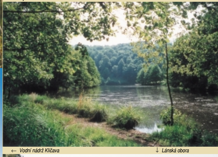
← Vodní nádrž Klíčava