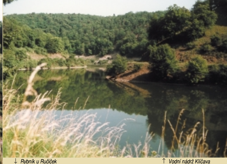
↓ Rybník u Ručiček