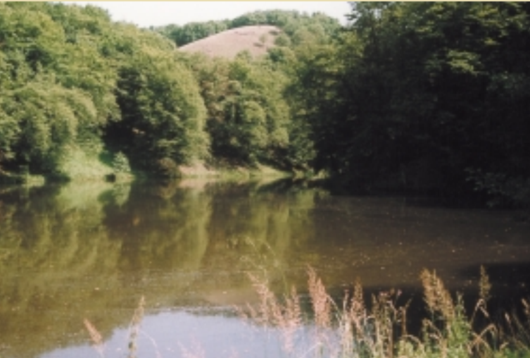
↓ Klíčava u přítoku